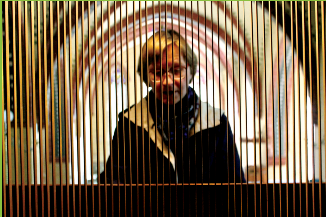
Blick aus dem Orgelinneren durch die Mechanik