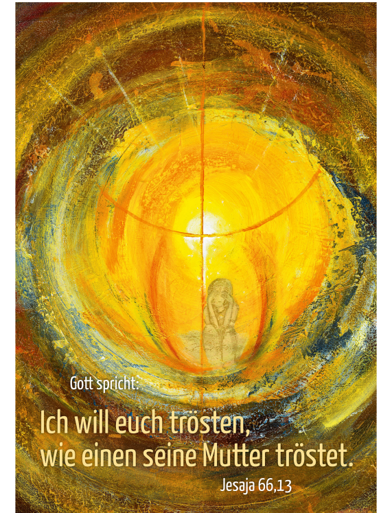
Acryl von U. Wilke-Müller

Im Verkündigungsdienst getragen und gestärkt!